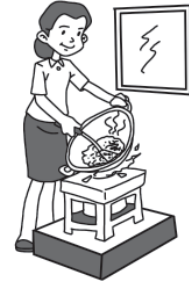
kompor untuk memasak

lihatlah ibu sedang memasak ibu memasak dengan kompor kompor berguna untuk memasak